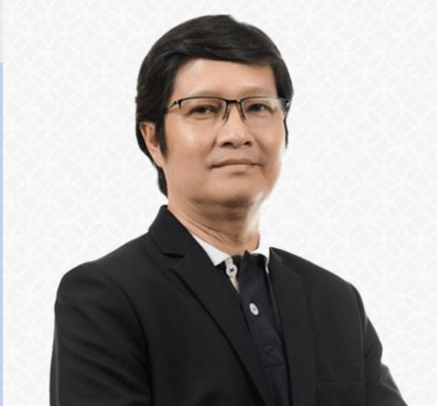
ศ.ดร. อาชา ประทีปเสน